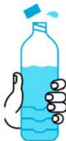
JE BOIS RÉGULIÈREMENT DE L'EAU

En période de canicule, quels sont les bons gestes?